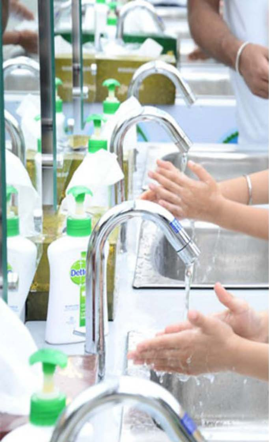
A legtöbb iskolában a civilizált mosdó csak egy álom.