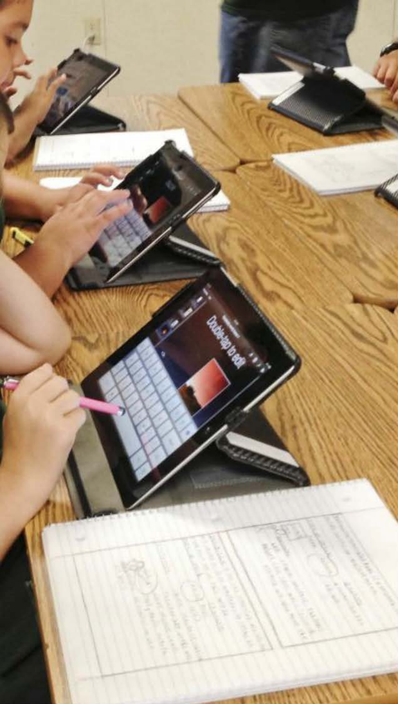
A táblagép szükség, nem hóbort.