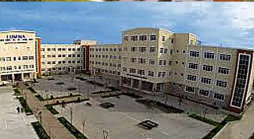
Bukaresti Nemzetközi Informatika Líceum